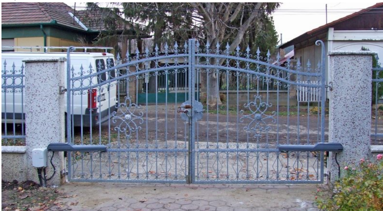
DITEC POWER35 szárnyas kapunyitó

Áramkimaradás esetén egy kulcs segítségével lehet a kaput függetleníteni a motortól. Ekkor a kapu kézi erővel is könnyedén nyitható és zárható. Ha újra van áram, a visszakapcsolás csak egy pillanat műve, és újra teljes a kényelem.