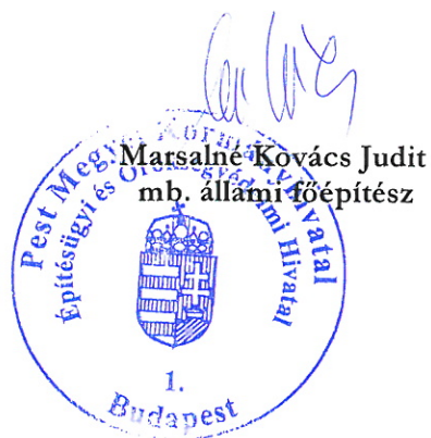
Marsalné Kovács Judit mb. állami főépítész